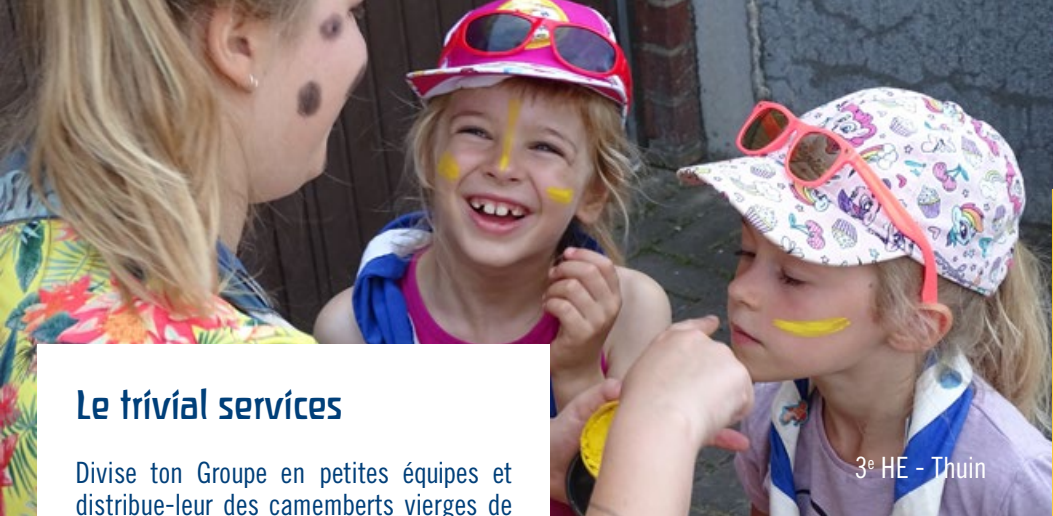
3 e HE - Thuin