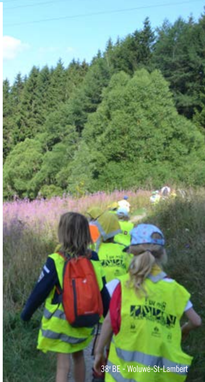
38° BE - Woluwé-St-Lambert

Option 2 : l'équipe d'intendance se considère comme une bulle à part entière et respecte strictement les mesures de distanciation et de port du masque lors des contacts, les plus limités possibles, avec les différentes bulles (cela sous-entend qu'ils cuisineront et assureront l'intendance, mais n'encadreront pas la distribution des repas ni les vaisselles qui devront être prises en charge par des membres de la bulle concernée). Toutes les interactions avec les autres bulles devront être indiquées dans les registres des bulles concernées.